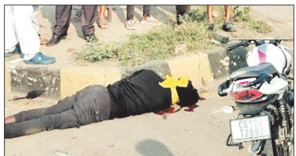
खरसिया का मामला, मार्ग कायम कर जांच में जुटी पुलिस

खरसिया थाना क्षेत्र अंतर्गत शुकवार की सुबह बाइक और स्कूटी की आमने-सामने जोरदार भिड़त हो गई। इस घटना में बाइक सवार युवक की मौत पर ही मौत हो गई। घटना की सूचना पर पुलिस ने मार्ग कायम कर मामले को विवेचना में लिया है।